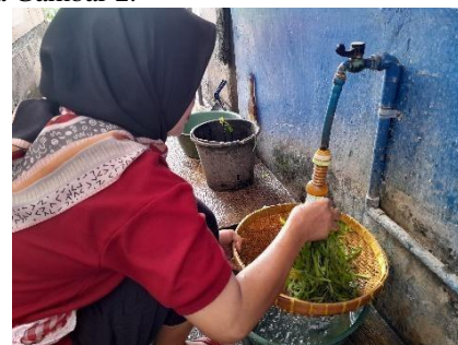
Gambar 2. Pencucian bahan baku dengan proses syar'i (Dokumentasi pribadi)

Penanganan bahan merupakan proses selanjutnya setelah pengadaan bahan, penanganan bahan meliputi penyimpanan bahan pangan, pengolahan bahan pangan hingga pengemasan makanan. Hal yang diperhatikan oleh PGC Catering dalam penanganan bahan yaitu, mulai dari pencucian bahan baku sebelum diolah hingga tata letak ruang yang berpengaruh terhadap kebersihan bahan dan lingkungan tempat produksi. Proses pencucian bahan yang dilakukan yaitu dengan cara menghilangkan najis, mencuci dengan dialirkan pada air mengalir, kemudian menghilangkan kotoran yang menempel pada bahan pangan. Pencucian bahan baku dengan proses syar'i dapat dilihat pada Gambar 2.