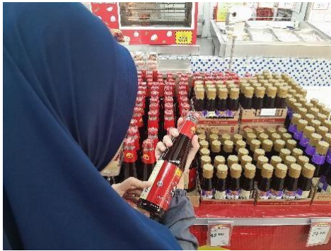
Gambar 1. Pengadaan bahan baku halal

mempertimbangkan lingkungan pasar yang bersih sehingga dapat dipastikan tidak adanya pencemaran dari bahan yang haram. Bahan baku seperti beras, penyedap, kecap, saus, cuka dan bahan tambahan lain yang digunakan diperiksa terlebih dahulu bahwa pada kemasan produk tertera label halal yang menandakan bahan pangan atau produk tersebut telah lolos sertifikasi halal. Label halal pada kemasan mempermudah pihak catering dalam memilih bahan yang akan digunakan dalam produksi (Suprianto & Fikri, 2019). Gambar 1 pengadaan bahan baku dapat dilihat pada Gambar 1.