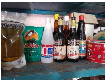
Gambar 4. Penyimpanan bahan baku

Penyimpanan bahan yang digunakan pada PGC Catering dijaga kebersihannya untuk mencegah kontaminasi dari zat-zat yang tidak halal, hal ini dilakukan pihak catering untuk tetap menjaga higienitas dan memastikan produk halal sesuai dengan standar halal (Saribanon et al., 2019). Penyimpanan bahan baku yang digunakan untuk catering hanya dilakukan untuk bahan kering seperti beras dan bahan tambahan seperti bumbu masak yaitu penyedap rasa, kecap manis, saus tiram, saus raja rasa, minyak wijen, minyak goreng, bawang bombay, bawang merah, bawang goreng, bawang putih, tepung bumbu, tepung beras, tepung terigu, tepung tapioka, mie kuning, mie bihun, santan instan, cuka makan, lada, garam dan gula, disimpan dalam rak bahan baku dekat dengan tempat produksi agar memudahkan saat proses produksi. Bahan baku mentah seperti ayam, daging, ikan, udang, tahu, tempe, sayuran dan tanaman toga untuk bumbu dibeli secara langsung setiap harinya sehingga keadaannya masih segar, untuk mempertahankan kualitas produk dan higienitas bahan tetap halal. Penyimpanan dapat dilihat pada Gambar 4.